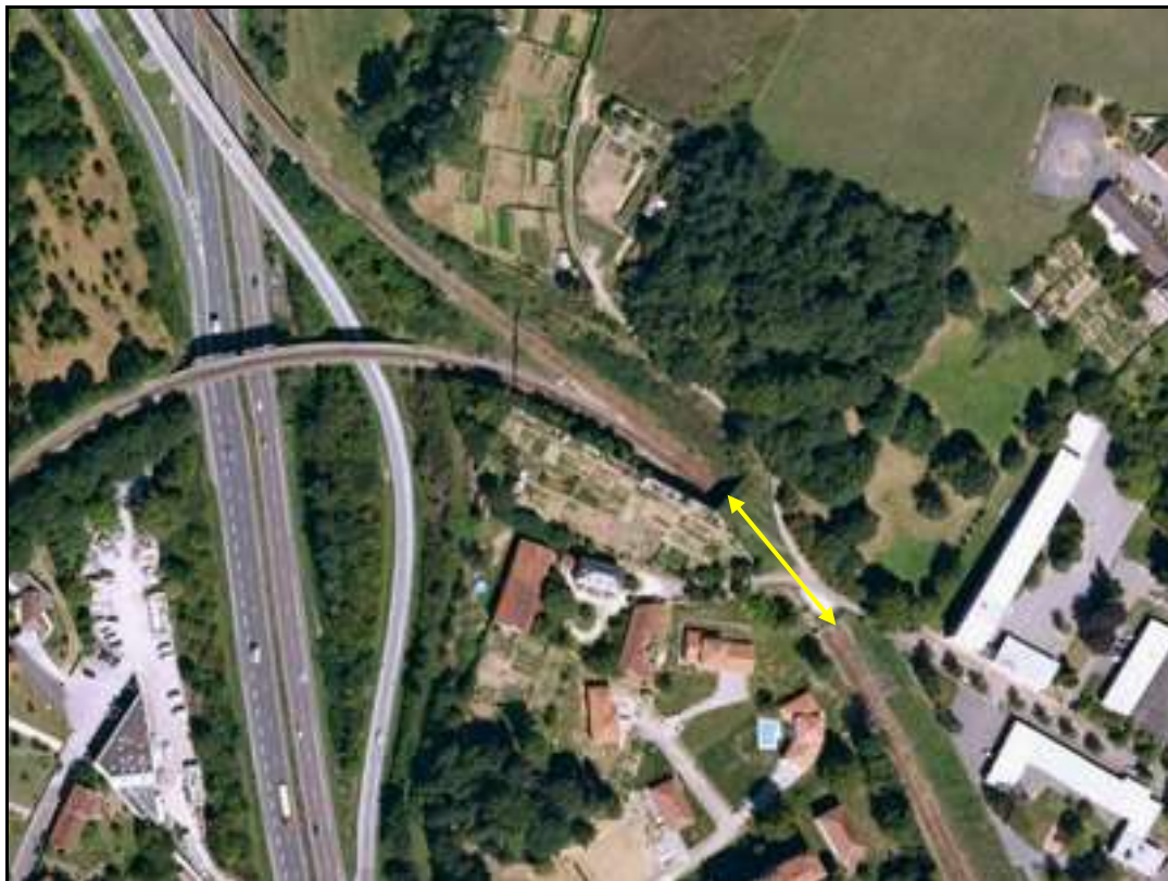
Vue aérienne de la galerie

Si cette fiche comporte des erreurs ou des oublis, merci de nous le signaler.