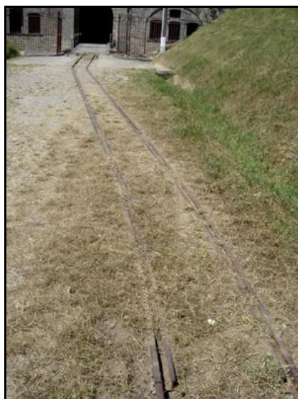
Deux vues de la remise en état du tronçon militaire Bois l'Abbé > Fort d'Uxegney

Par ailleurs, après la récupération de l'Alsace et la Lorraine suite au premier conflit mondial, les Vosges ont été le théâtre du creusement de deux grands tunnels ferroviaires qui devaient faciliter la traversée du massif. Cependant, ces deux souterrains quasiment jumeaux ont eu une triste histoire bien éloignée de leur vocation initiale. Ils ont tout d'abord servi d'usines d'aviation souterraines que les Allemands ont fait construire à des déportés pendant la dernière guerre. Puis ils ont eu une triste fin :