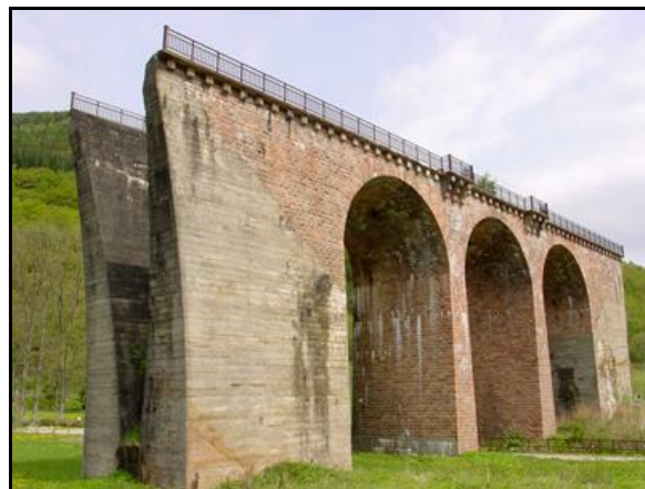
Un bien curieux monument à la gloire éphémère du chemin de fer

Si vous pouvez nous apporter des détails complémentaires, ou si cette notice comporte des erreurs, merci de nous le signaler.