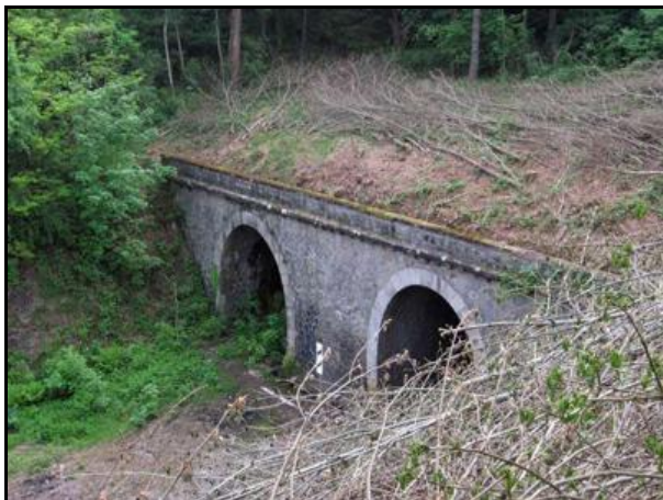
L'entrée du tunnel est ici au premier plan