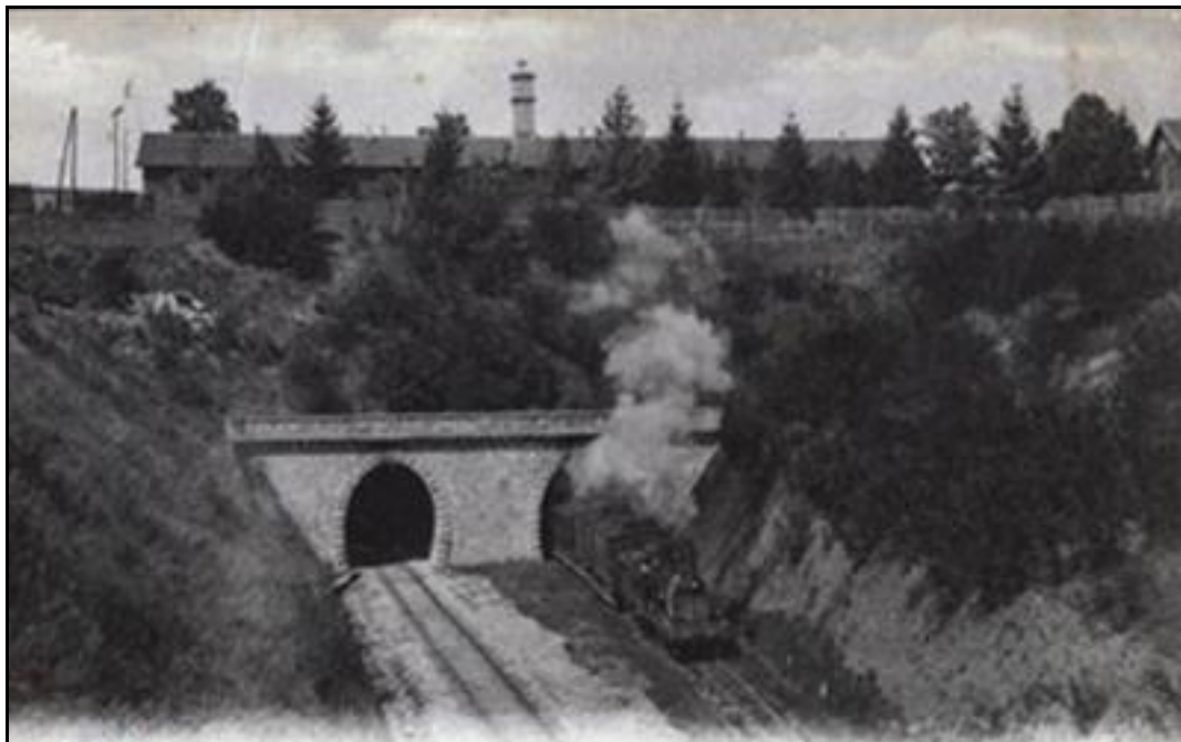
Ci-dessus et ci-dessous, deux belles photos d'époque la sortie des tunnels de Bruyères