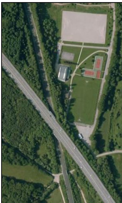
Vue aérienne de la galerie sous la route

Si cette fiche comporte des erreurs ou des oublis, merci de nous le signaler.