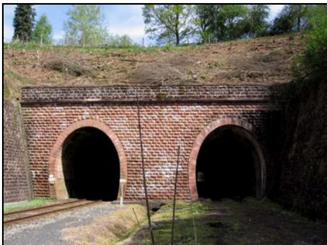
L'entrée du tunnel est ici à droite