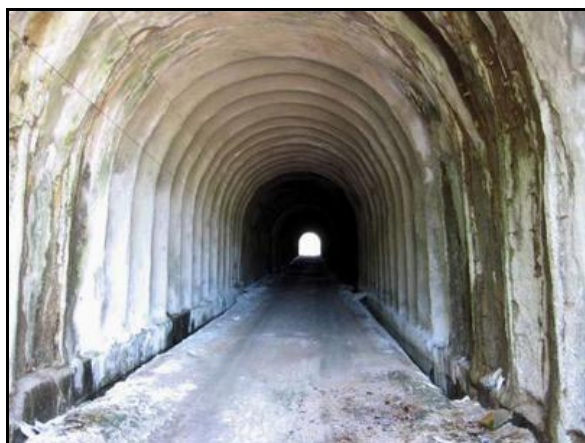
Ci-contre, la galerie abandonnée du tunnel Vanémont 1 Voie 2

Si cette fiche comporte des erreurs ou des oublis, merci de nous le signaler.