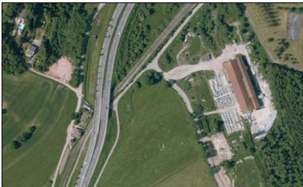
Vue aérienne de la galerie sous la route

Si cette fiche comporte des erreurs ou des oublis, merci de nous le signaler.