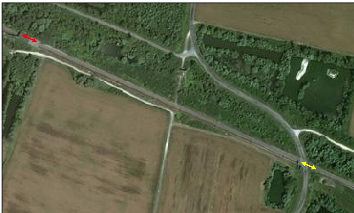
Vue aérienne des deux sauts de mouton des Pourots Flèche rouge : saut de mouton des Pourots 1 Flèche jaune : saut de mouton des Pourots 2

Si cette fiche comporte des erreurs ou des oublis, merci de nous le signaler.