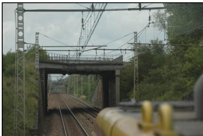
Au loin, le saut de mouton des Pourots 1