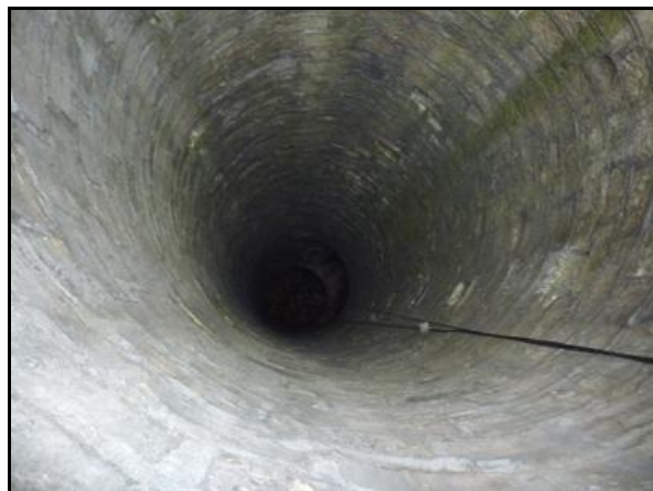
Le débouché de la cheminée d'aération du tunnel et son puits vu du haut