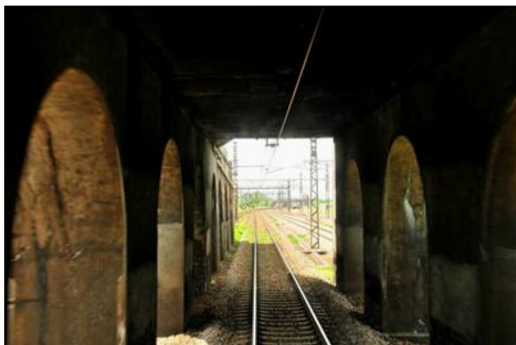
Ci-contre, l'entrée centrale vue de l'intérieur