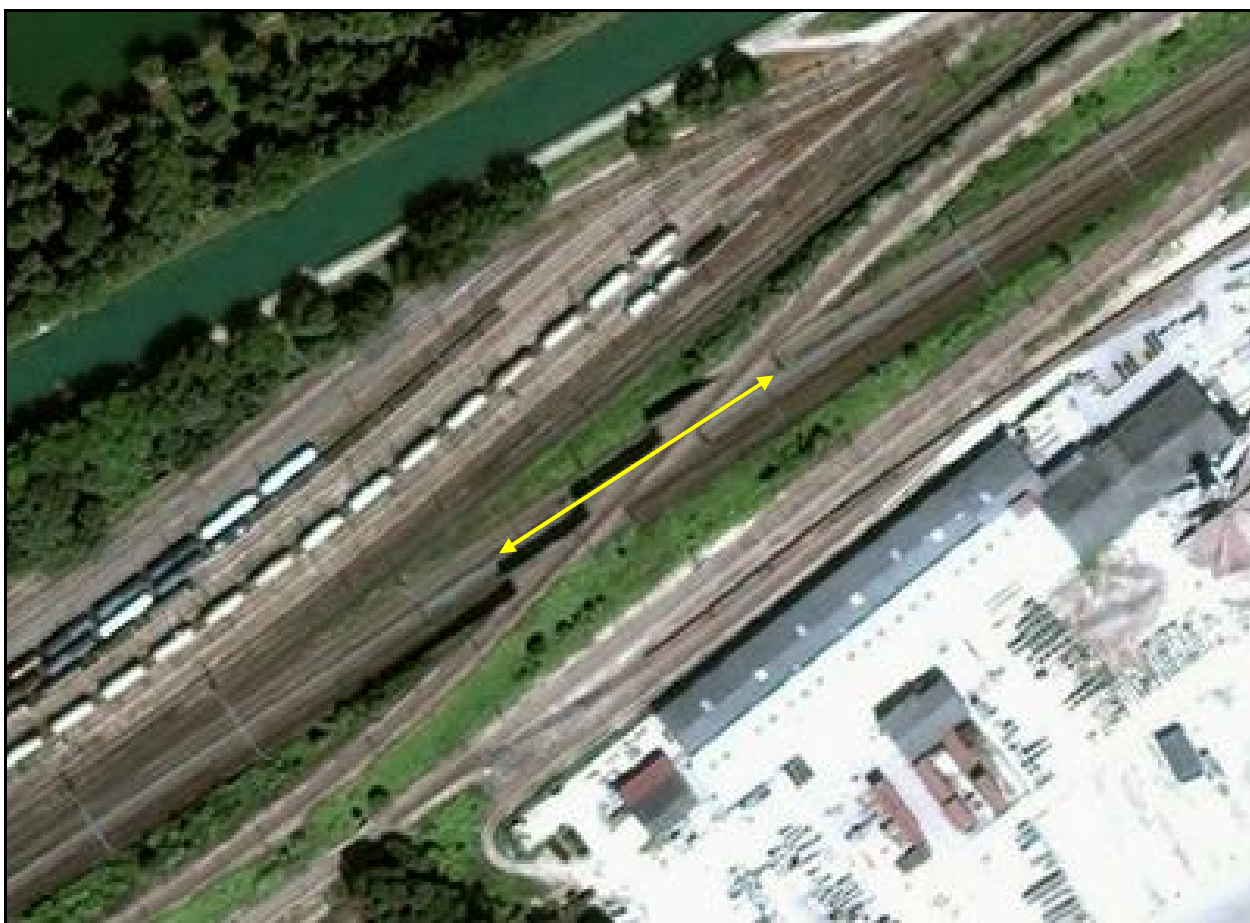
Vue aérienne du saut de mouton des Grèves de Fouchy

Si cette fiche comporte des erreurs ou des oublis, merci de nous le signaler.