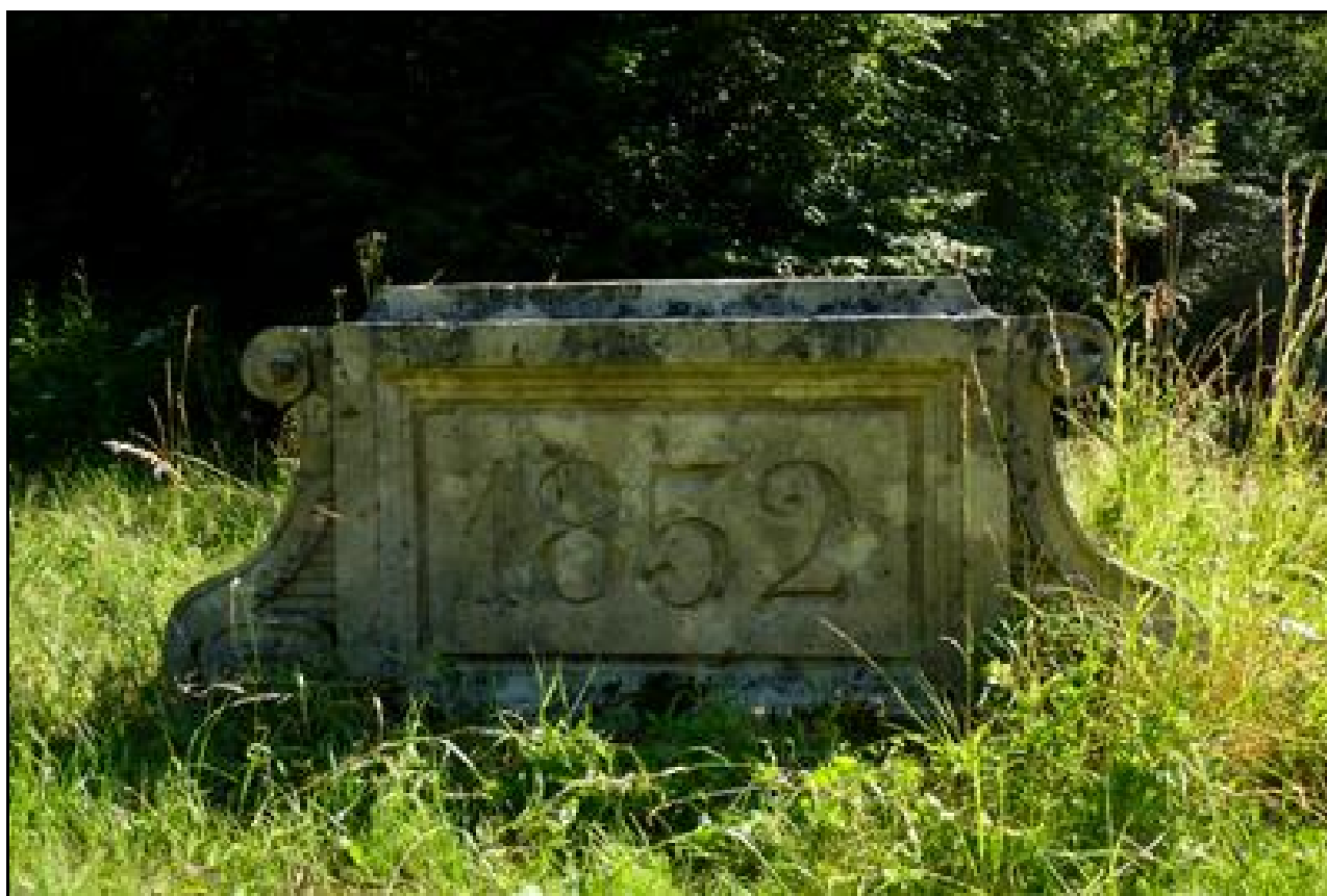
La très belle pierre de fronton portant la date de creusement du tunnel a été déposée Elle gît dans l'herbe, à côté de l'ouvrage

Si cette fiche comporte des erreurs ou des oublis, merci de nous le signaler.