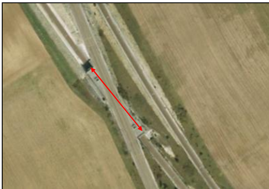
Vue aérienne du saut de mouton LGV de Soulangy

Si cette fiche comporte des erreurs ou des oublis, merci de nous le signaler.