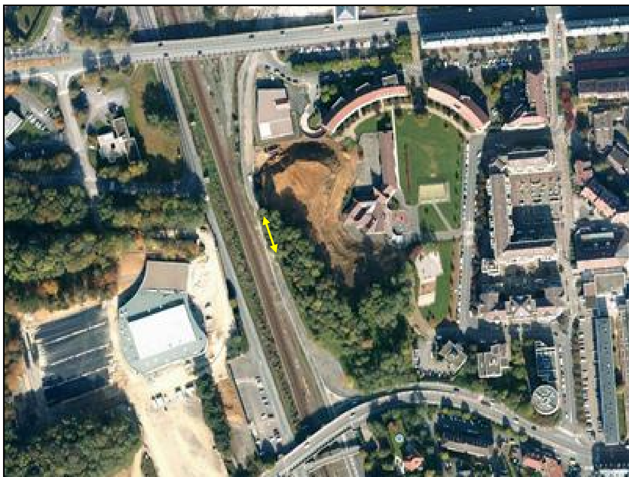
Vue aérienne de l'emplacement de la galerie

Si cette fiche comporte des erreurs ou des oublis, merci de nous le signaler.