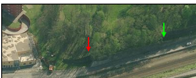
L'entrée et la sortie de la galerie vues du ciel