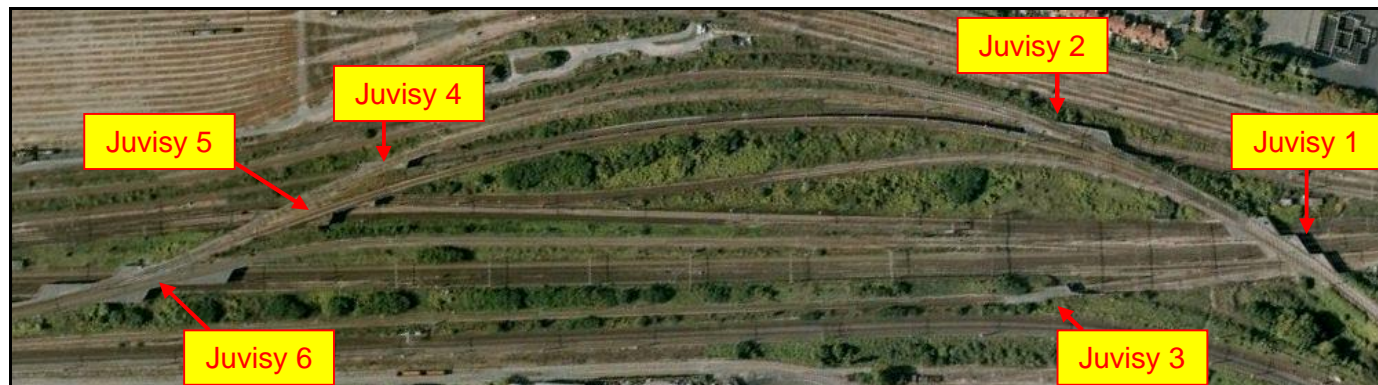
Vue aérienne de la gare de triage de Juvisy et de ses 6 sauts de mouton

La saut de mouton Juvisy 1 comporte, de droite à gauche (ou d'ouest en est), 3 galeries décalées :