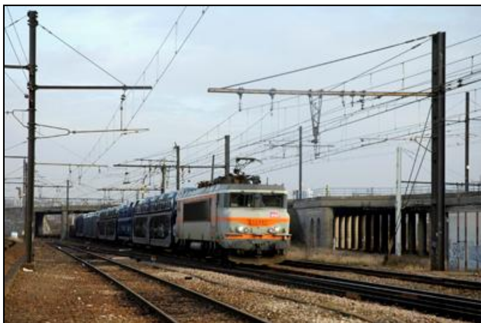
La galerie Juvisy 5 d'où sort le train, côté sortie A droite de la locomotive, la sortie de la galerie Juvisy 6

Si cette fiche comporte des erreurs ou des oublis, merci de nous le signaler.