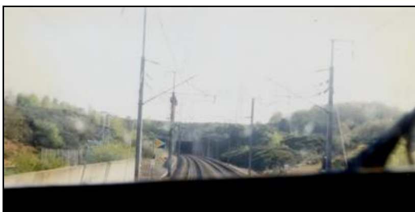
La sortie de la tranchée couverte de Briis vue depuis la cabine d'un TGV