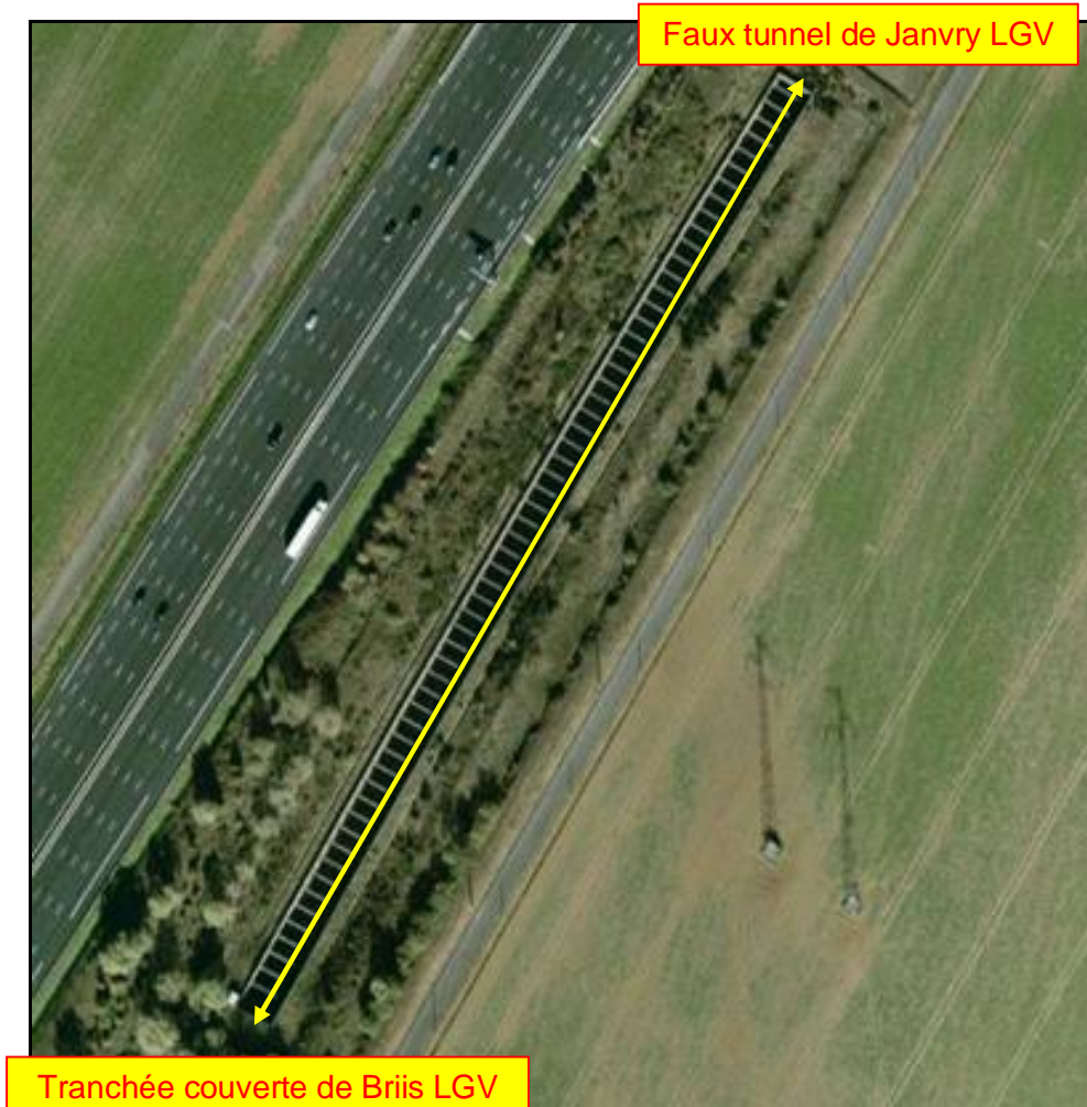
Détail de la tranchée en encoffrement

La tranchée est séparée du faux tunnel de Janvry par une tranchée semi-couverte en encoffrement.