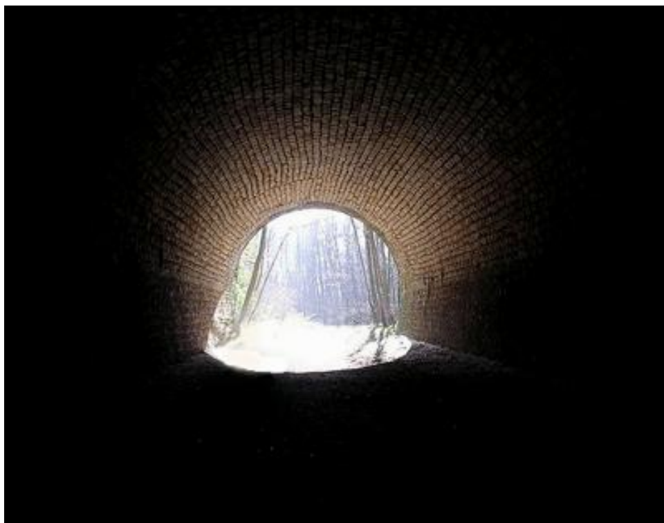
Ci-dessus et ci-dessous, trois photos de la jolie galerie de Montjay