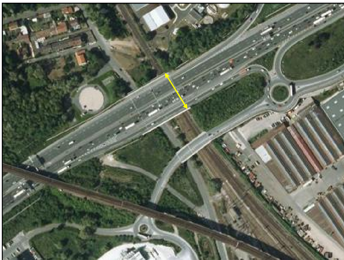
Vue aérienne de la galerie de la Francilienne

Quelqu'un a pris mon derrière. Qui prendra mon visage ?