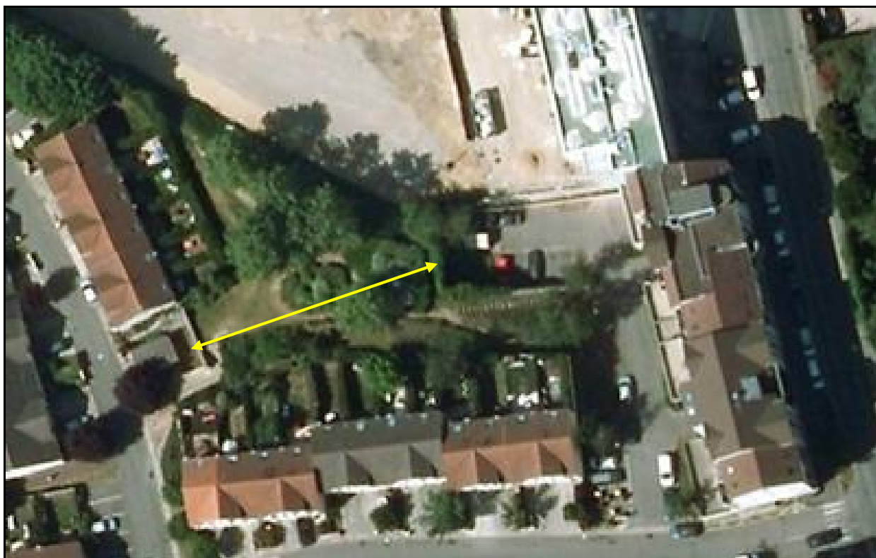
Vue aérienne actuelle de l'emplacement du saut de mouton A comparer avec la vue d'époque

Si cette fiche comporte des erreurs ou des oublis, merci de nous le signaler.