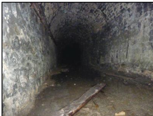
Ci-dessus et ci-dessous, divers aspects de la galerie