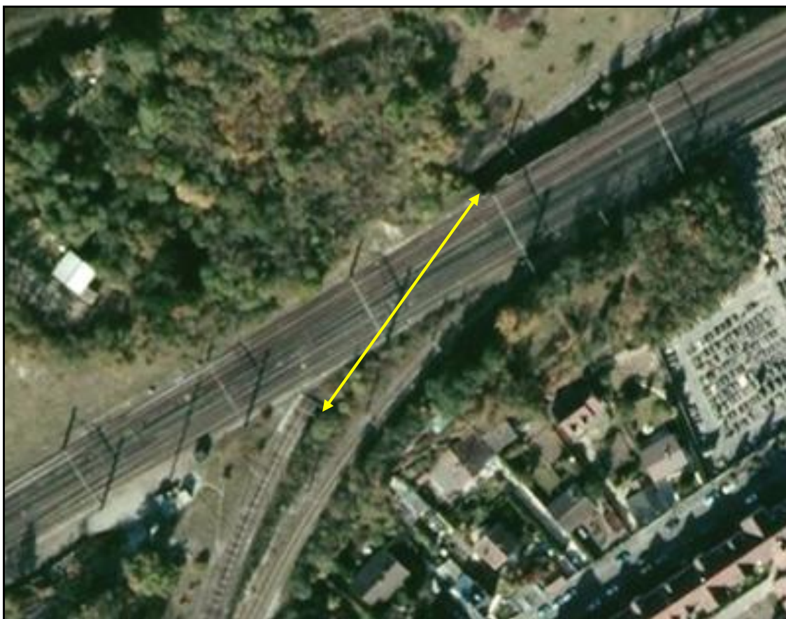
Vue aérienne du saut de mouton

Si cette fiche comporte des erreurs ou des oublis, merci de nous le signaler.