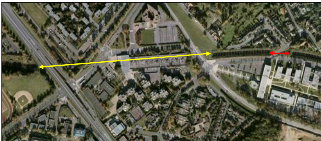
Vue aérienne des deux galeries d'Evry Bras de Fer En jaune, galerie d'Evry Génopole ou Bras de Fer 1 En rouge, galerie de Bras de Fer ou Bras de Fer 2

Aussi appelé galerie de Bras de Fer 2, ce faux tunnel a été construit pour livrer passage supérieur à une voie urbaine.