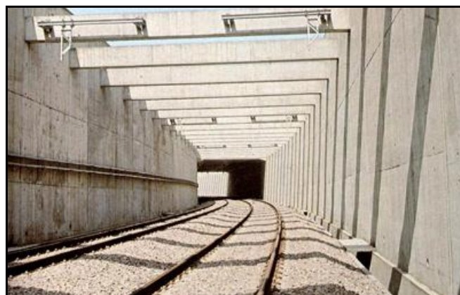
La galerie de Bras de Fer juste après sa construction alors que la ligne n'est pas encore électrifiée

Quelqu'un a pris mon derrière. Qui prendra mon visage ?