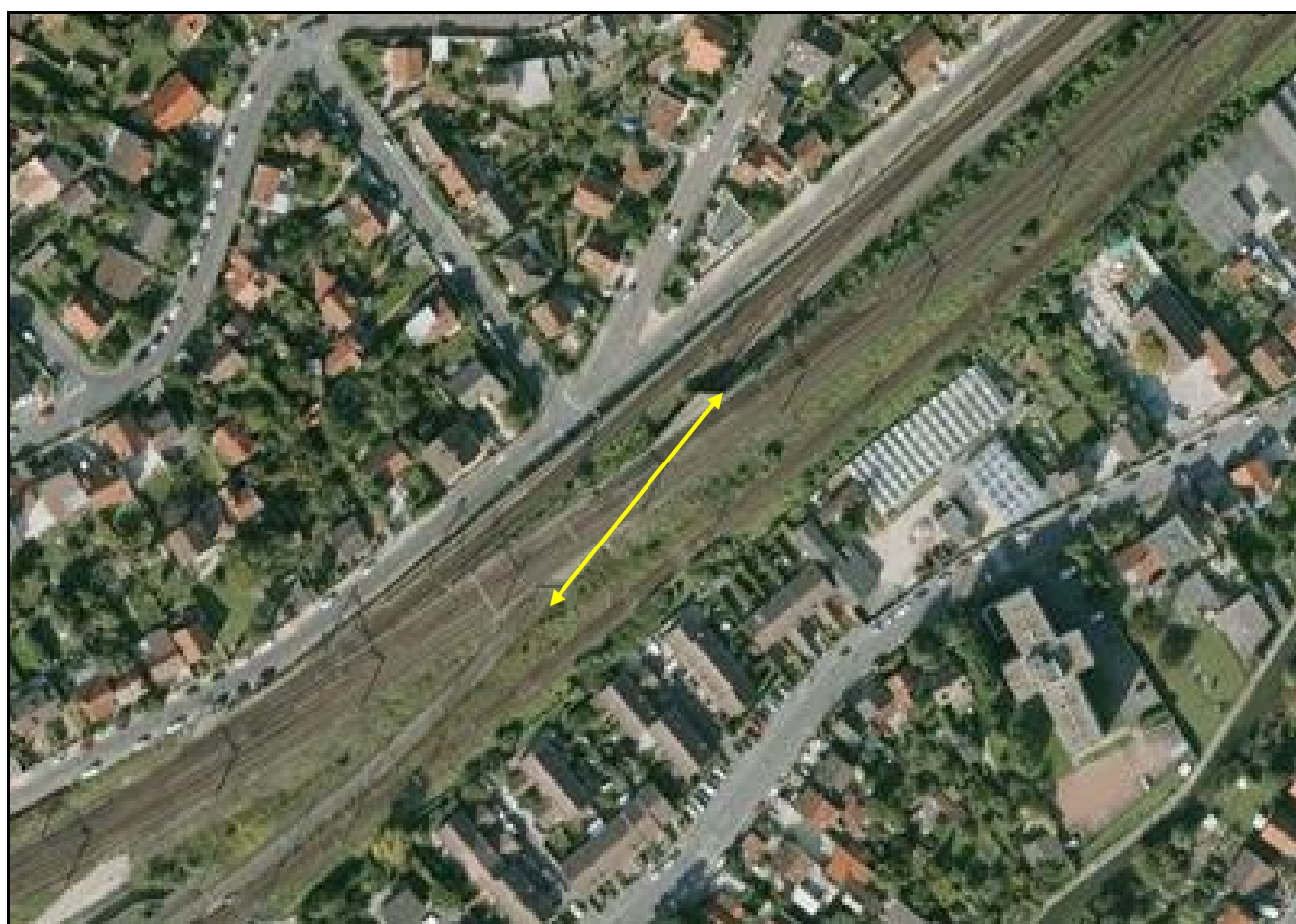
Vue aérienne du saut de mouton

Si cette fiche comporte des erreurs ou des oublis, merci de nous le signaler.