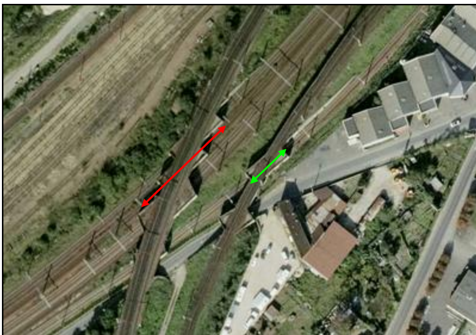
Vue aérienne des sauts de mouton de l'île Brune En rouge, saut de mouton de l'île Brune 1 En vert, saut de mouton de l'île Brune 2 A noter la présence d'une galerie routière voisine

Si cette fiche comporte des erreurs ou des oublis, merci de nous le signaler.