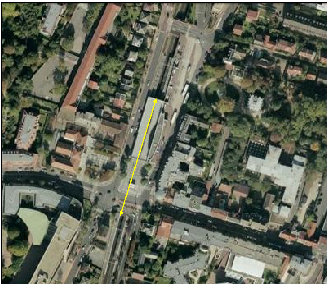
Vue aérienne de la gare

Si cette fiche comporte des erreurs ou des oublis, merci de nous le signaler.