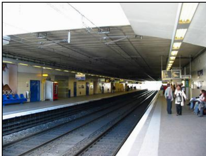
La galerie de la gare