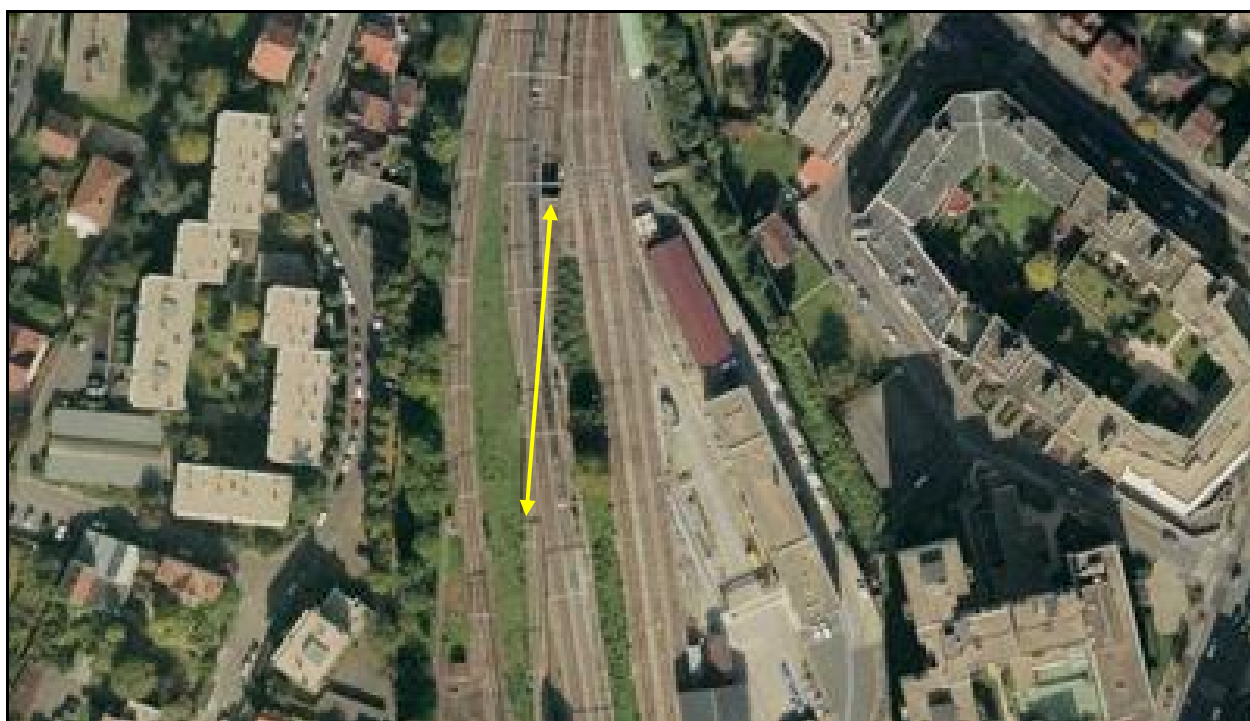
Vue aérienne du saut de mouton de la gare de Bourg la Reine

Si cette fiche comporte des erreurs ou des oublis, merci de nous le signaler.