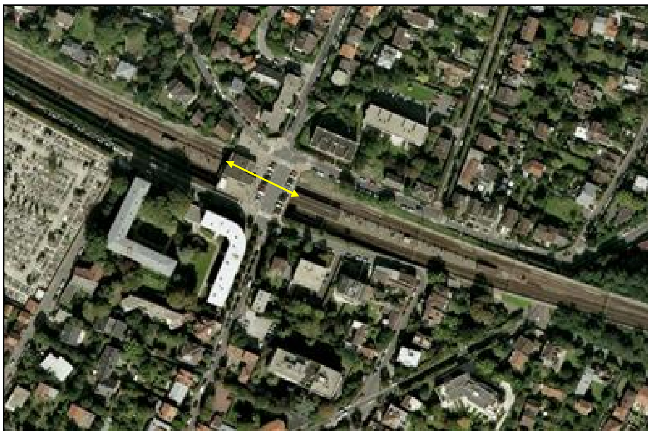
Vue aérienne de la gare de Bas Meudon

Si cette fiche comporte des erreurs ou des oublis, merci de nous le signaler.