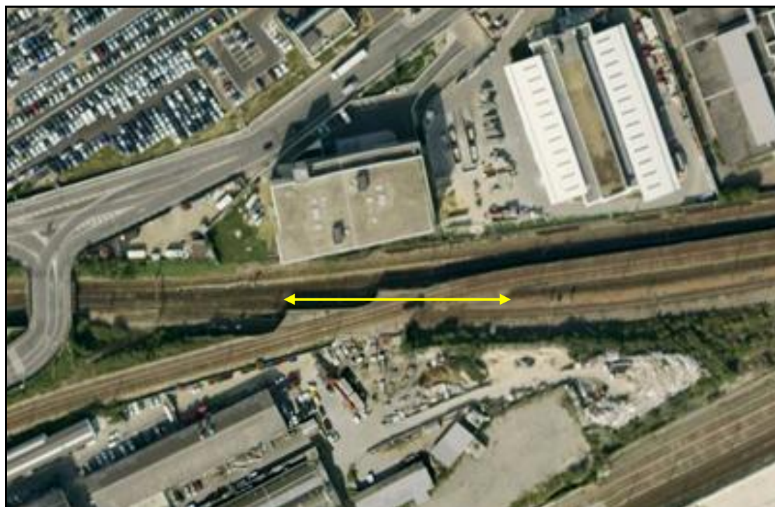
Vue aérienne du saut de mouton de la Folie et de ses deux galeries

Quelqu'un a pris mon derrière. Qui prendra mon visage ?