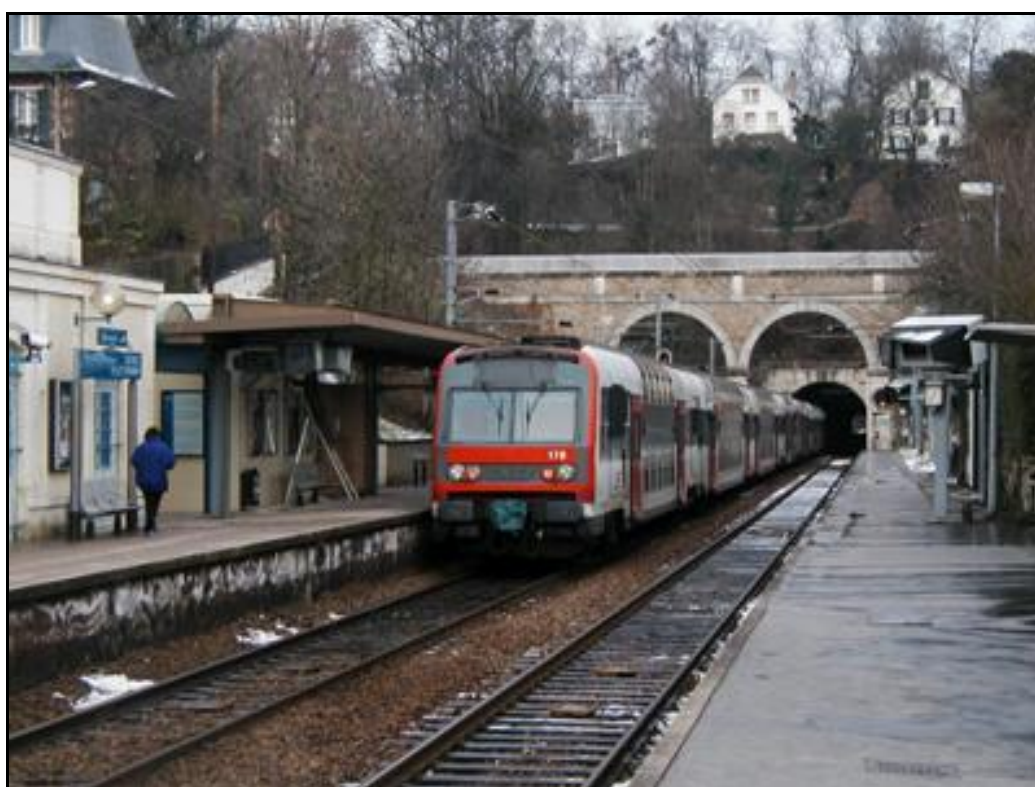
La sortie du tunnel au second plan derrière les arches de la passerelle