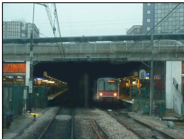
La sortie du tunnel et la gare de Val de Fontenay

Quelqu'un a pris mon derrière. Qui prendra mon visage ?