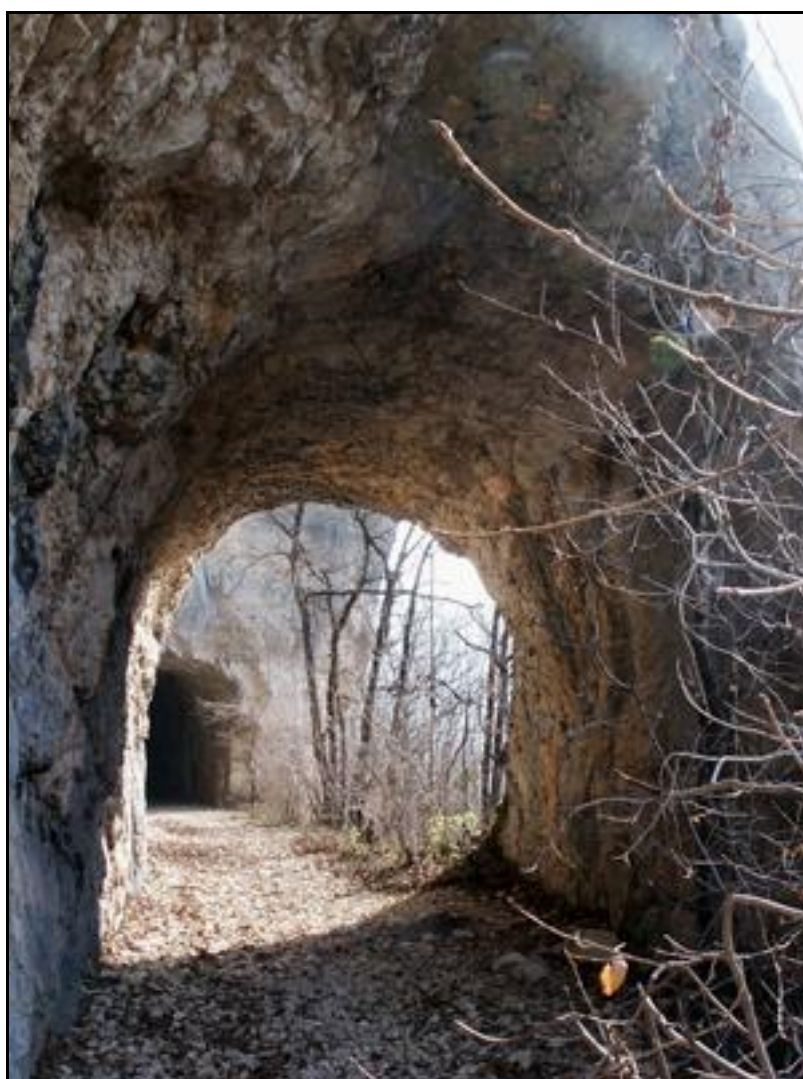
Gros plan sur la courte galerie vue depuis la sortie

Si cette fiche comporte des erreurs ou des oublis, merci de nous le signaler.