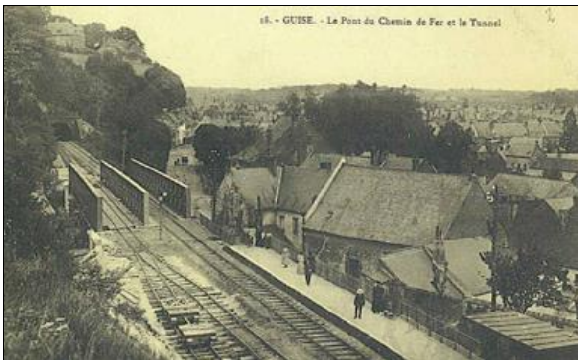
L'entrée du tunnel : photo conforme avec la ligne métrique à gauche et la voie normale à droite L'écartement des voies apparaît nettement sur les tabliers du pont