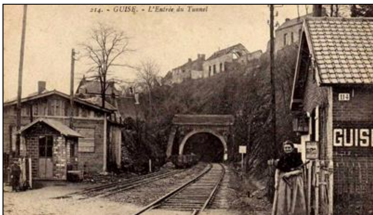
La sortie du tunnel : photo non-conforme avec deux voies normales et la ligne métrique insérée dans celle de... droite (par rapport à l'entrée)

Toutes ces voies ferrées sont détruites pendant la première guerre mondiale, mais pas le tunnel. Elles sont reconstruites après guerre et, à cette occasion, l'ex ligne métrique Guise > Hirson est mise en écartement normal avec tronç commun à voie unique de Guise à Beaurain. Le tunnel est donc à nouveau en voie unique comme au temps de ses débuts.