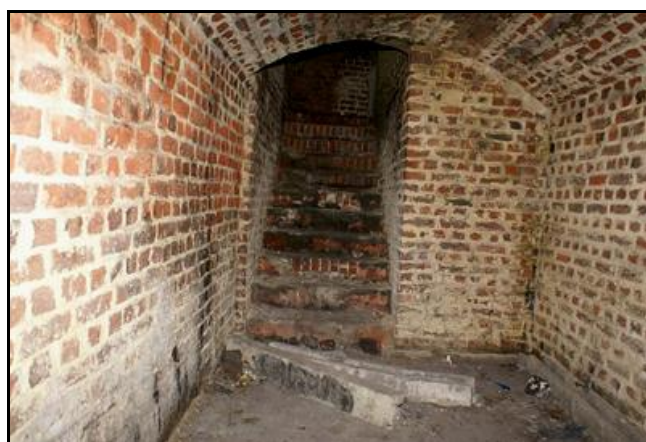
Les antichambres d'accès gauche et droite