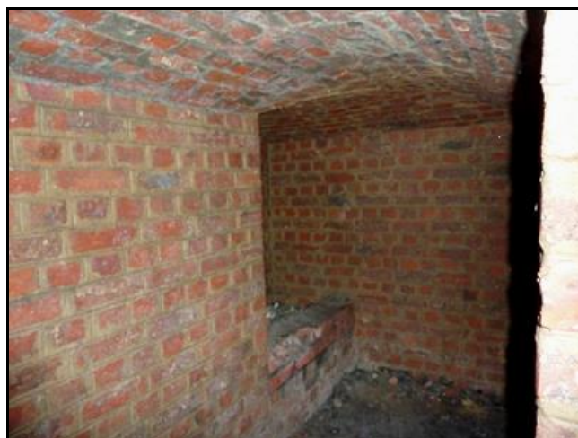
Les fourneaux de mines