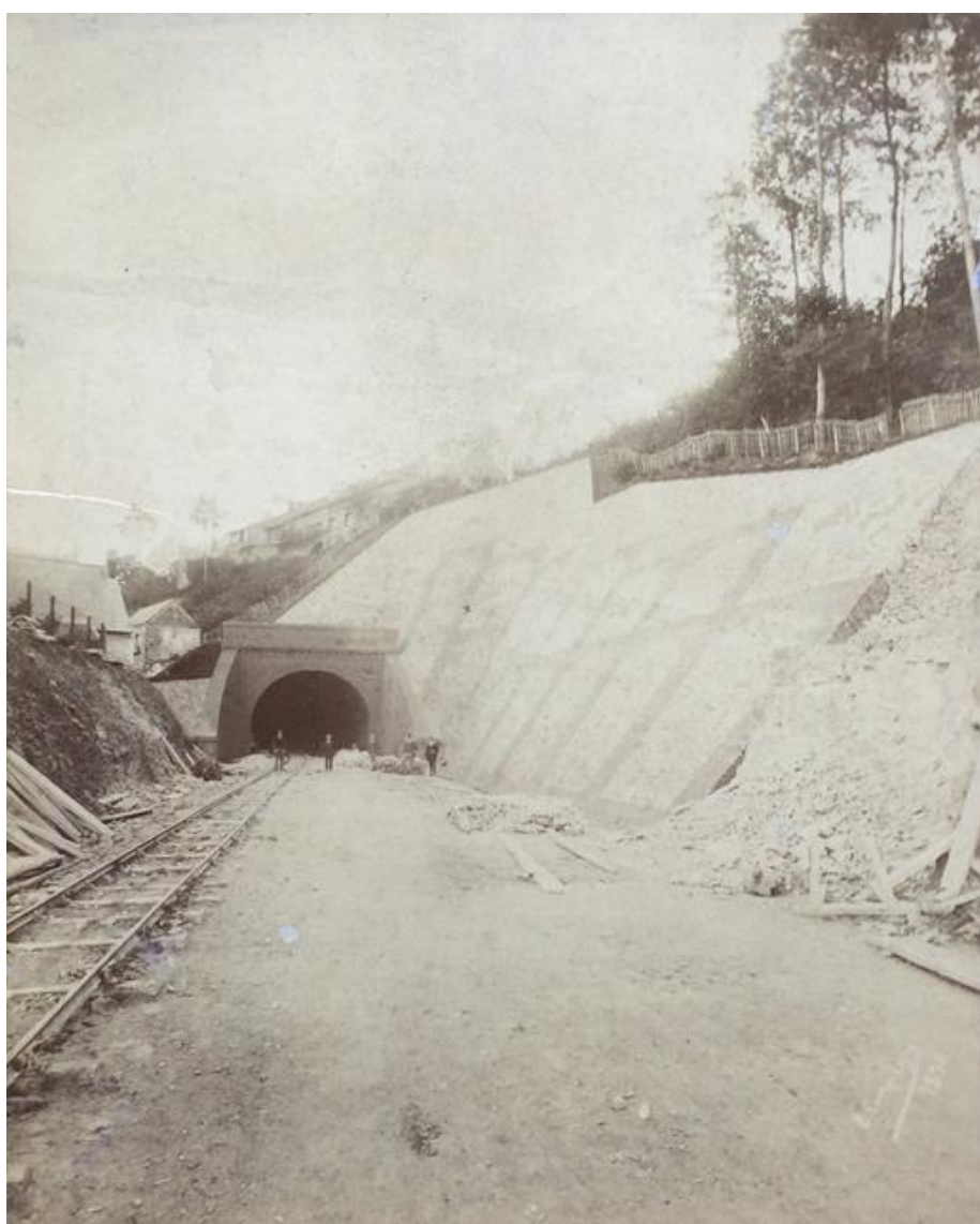
La sortie du tunnel lors de sa construction

Si cette fiche comporte des erreurs ou des oublis, merci de nous le signaler.