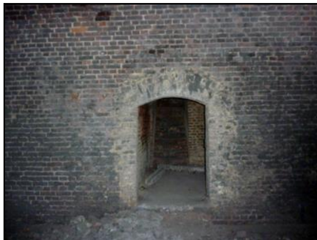
Accès aux chambres de dynamitage latérales gauches et droites