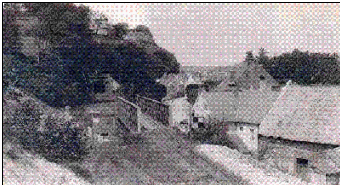
Ce vieux cliché de mauvaise qualité montre l'entrée du tunnel après 1896 avec la ligne normale Laon >Wassigny

En 1896, la ligne Laon > Wassigny, elle aussi à voie unique en écartement normal, atteint Guise par le sud. Elle contourne la ville par l'ouest en passant dans un tunnel creusé sous la colline du château. En prévision d'une extension probable du réseau ferré, ce tunnel est construit au gabarit double voie. Son entrée est au sud, sa sortie au nord, et la gare de Guise au nord de cette sortie.