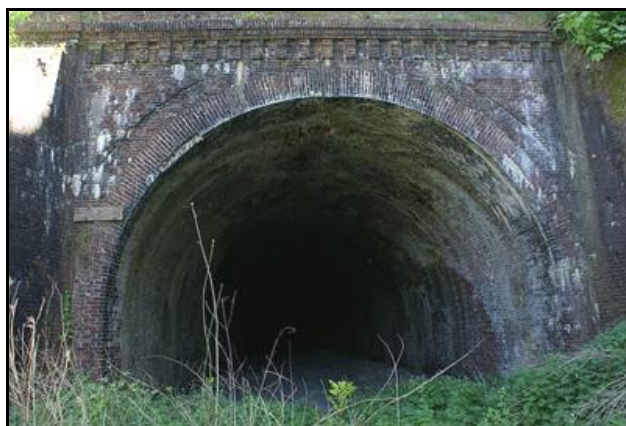
L'entrée et la sortie du tunnel avant qu'elles ne soient fermées par des grilles