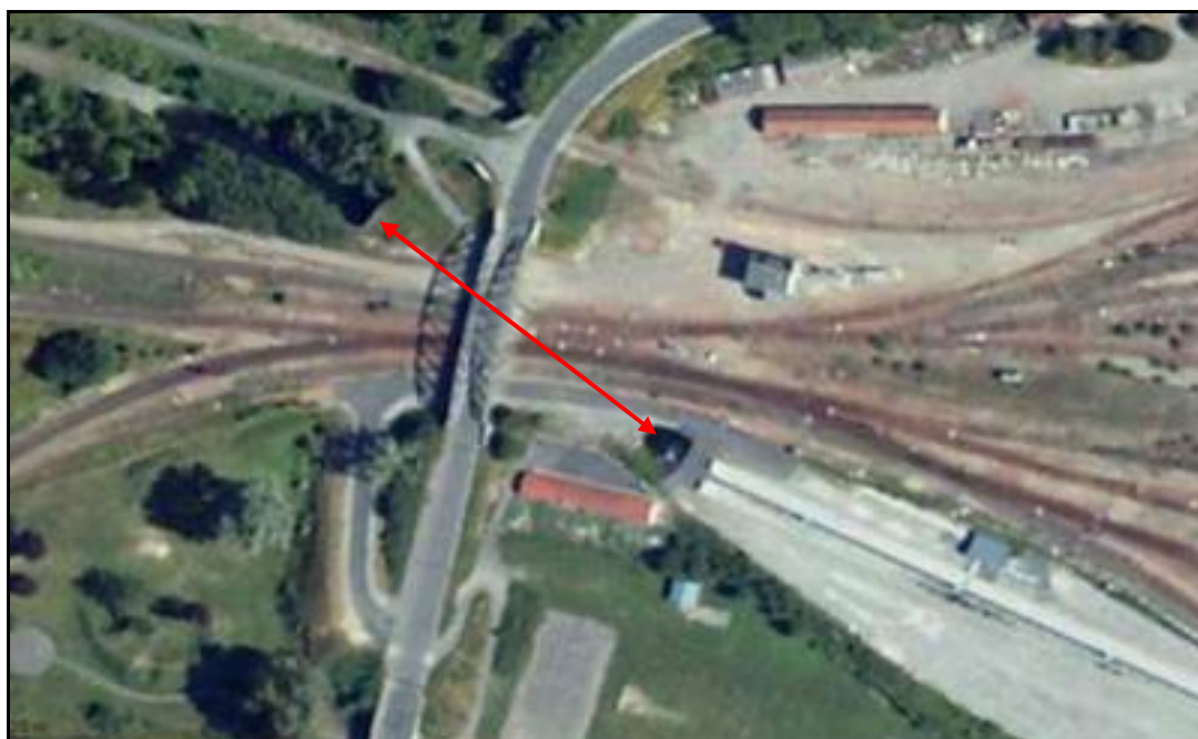
Vue aérienne du saut de mouton

Si cette fiche comporte des erreurs ou des oublis, merci de nous le signaler.