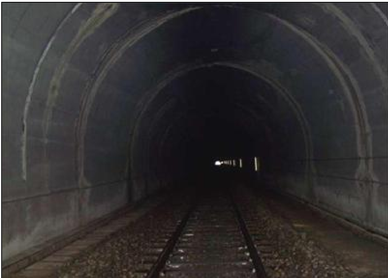
La belle galerie refaite du tunnel de Margival

Si cette fiche comporte des erreurs ou des oublis, merci de nous le signaler.