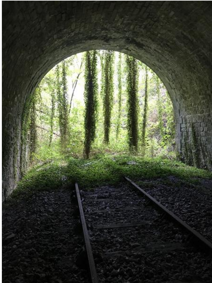
Vue vers la sortie depuis l'intérieur (18/08/2020)