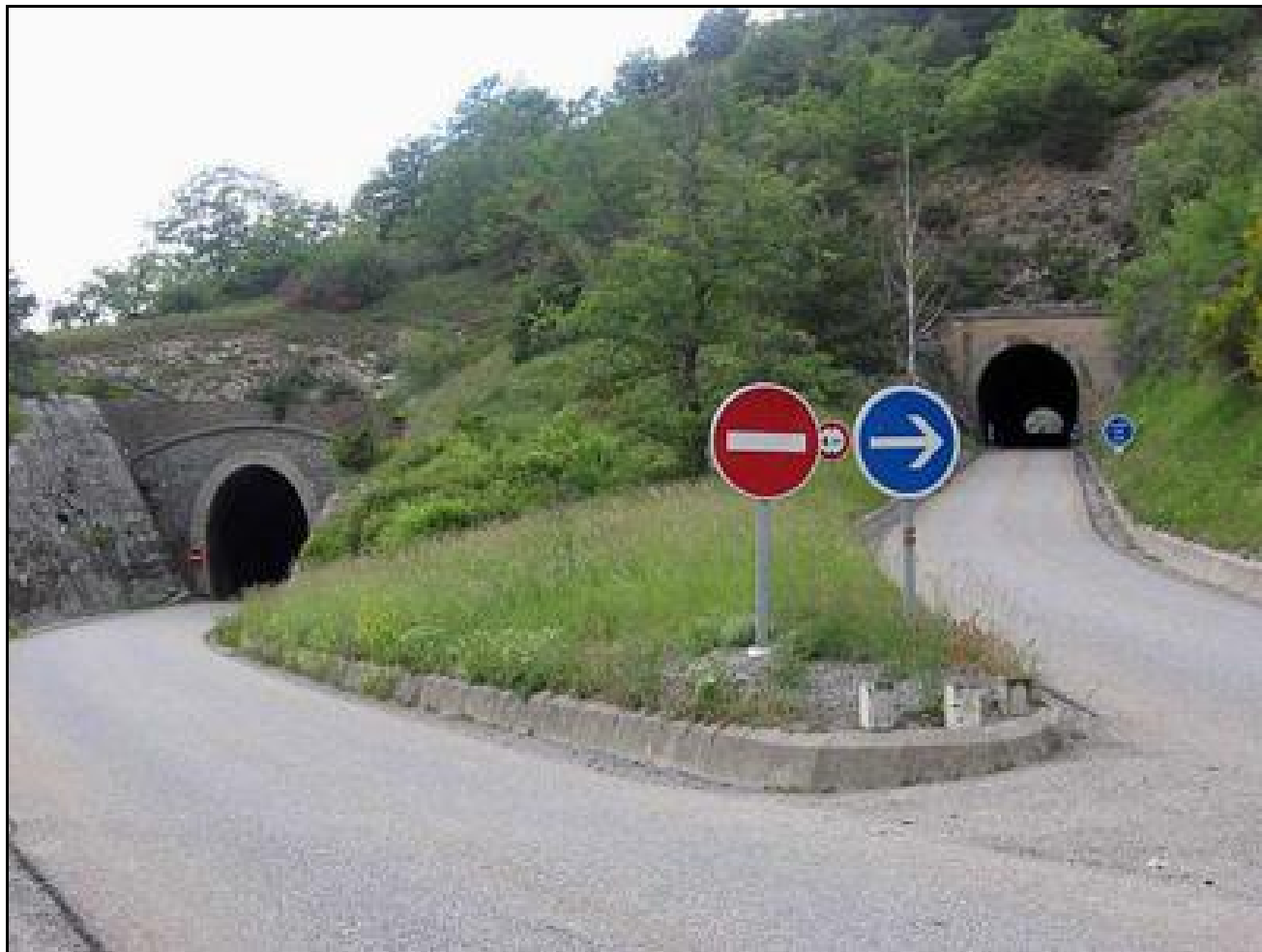
A gauche, la sortie de l'ex tunnel ferroviaire, à droite le tunnel routier

Si cette fiche comporte des erreurs ou des oublis, merci de nous le signaler.