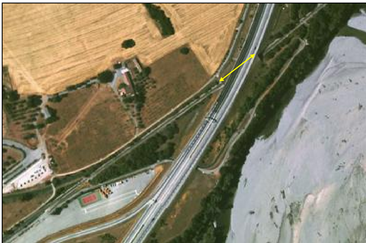
Vue aérienne de la galerie sous l'autoroute A 51

Si cette fiche comporte des erreurs ou des oublis, merci de nous le signaler.