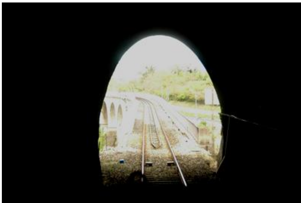
L'entrée du tunnel vue de l'intérieur avec le viaduc qui la précède

Si cette fiche comporte des erreurs ou des oublis, merci de nous le signaler.