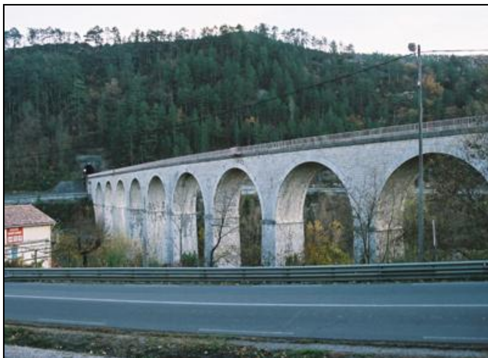
L'entrée du tunnel au bout du viaduc de Sisteron