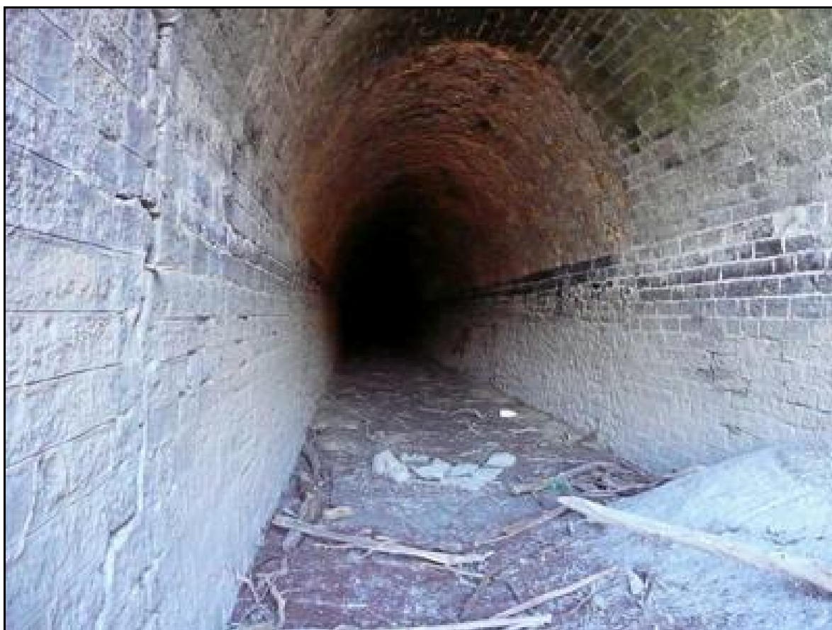
L'intérieur en bon état de la galerie normalement noyée