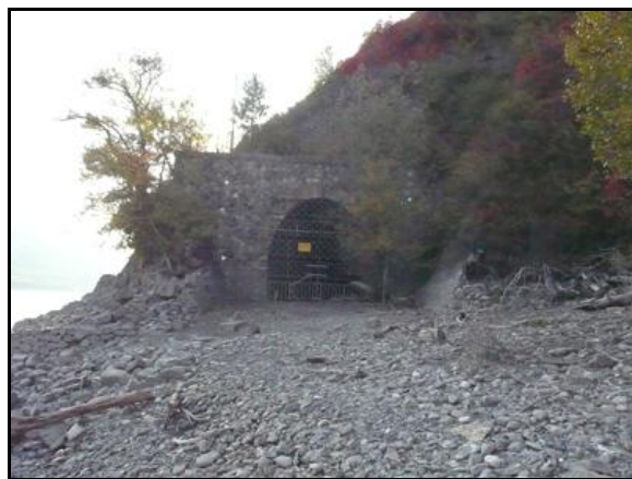
Autres vues de l'entrée et de la sortie du tunnel de Bassonne

Si cette fiche comporte des erreurs ou des oublis, merci de nous le signaler.