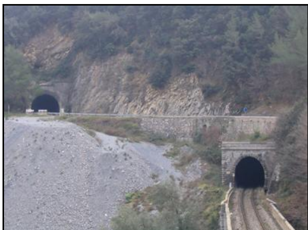
A gauche du tunnel ferroviaire, un tunnel routier