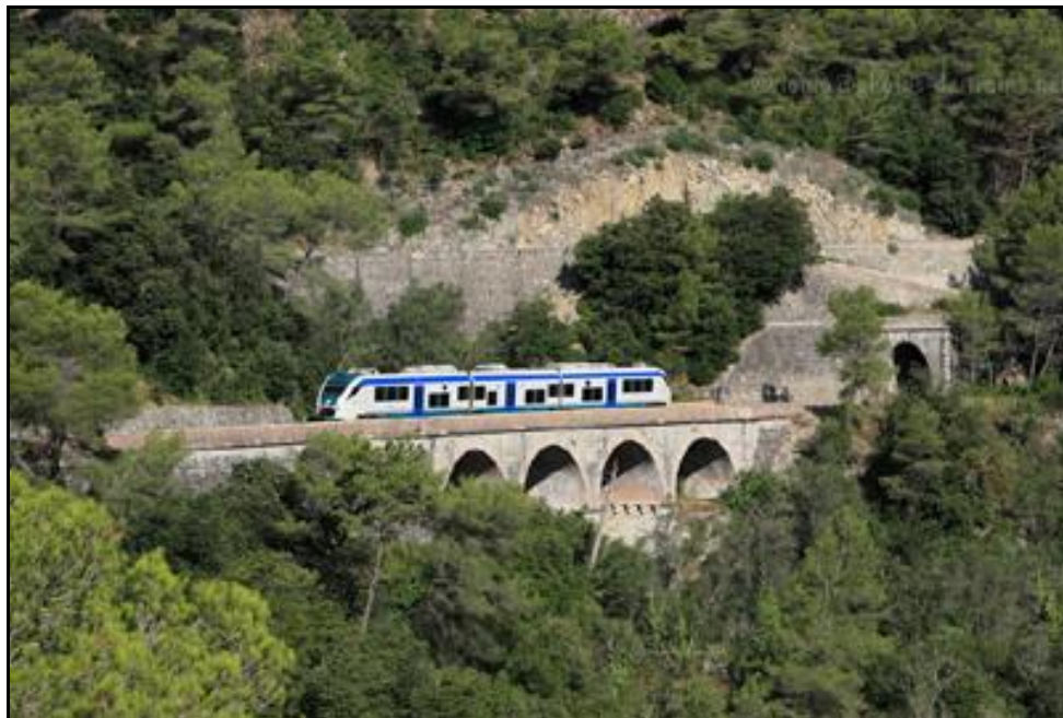
Train italien à la sortie du tunnel de l'Arme

Si cette fiche comporte des erreurs ou des oublis, merci de nous le signaler.