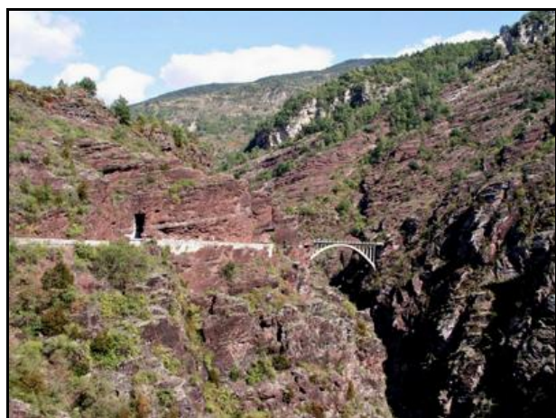
L'entrée du tunnel et le pont de la Mariée

Quelqu'un a pris mon derrière. Qui prendra mon visage ?