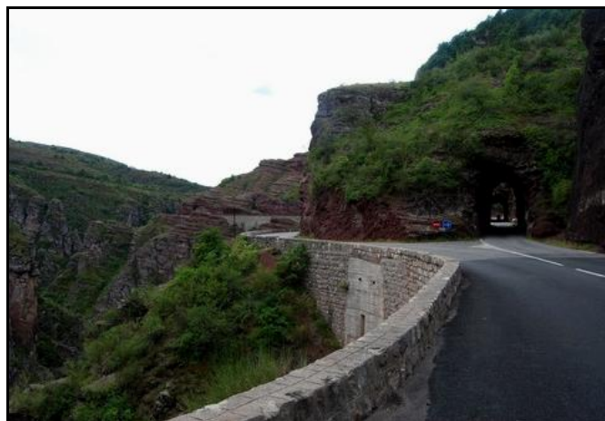
Les tunnels n° 17 et 16 en alignement