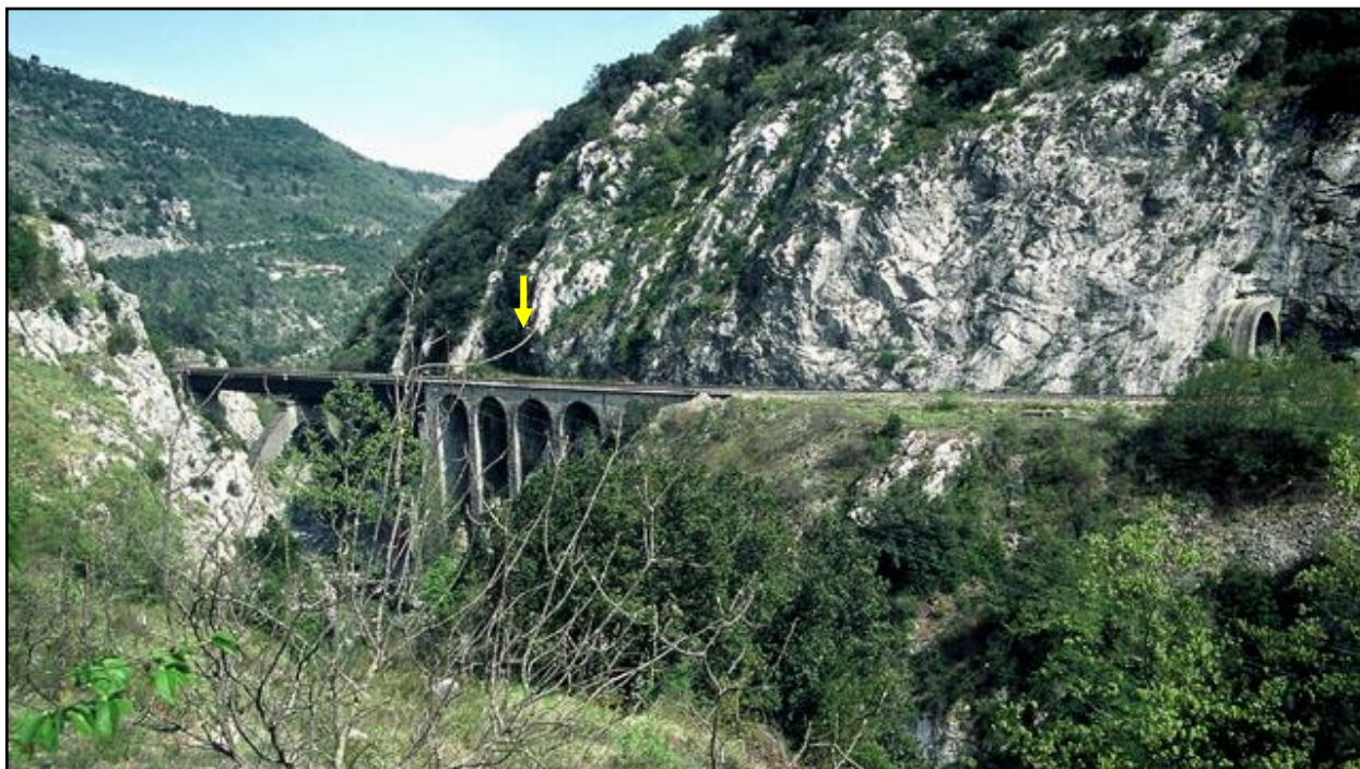
L'entrée du tunnel (à droite) et le viaduc de Cai La flèche jaune indique le débouché de la galerie annexe