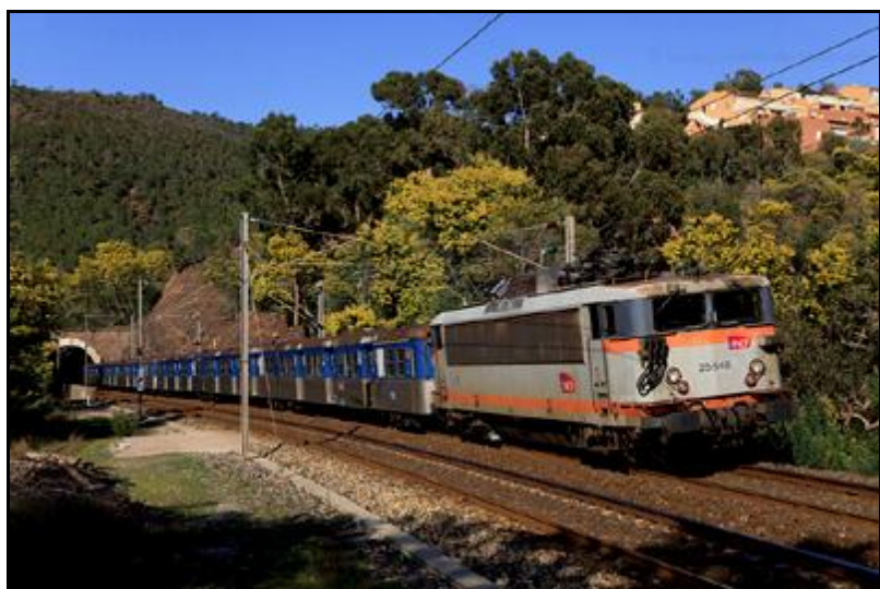
Un train se dirigeant vers le Var sort de l'entrée du tunnel

Si cette fiche comporte des erreurs ou des oublis, merci de nous le signaler.