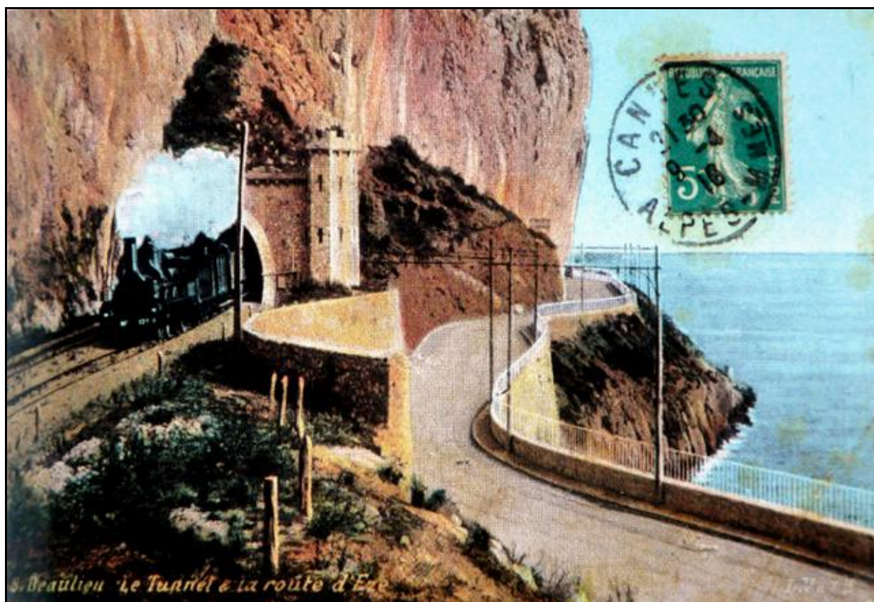
Carte postale colorisée d'époque montrant l'entrée du tunnel du temps de la vapeur Les poteaux métalliques de la route supportent le fil trolley du Tramway TNL

Si cette fiche comporte des erreurs ou des oublis, merci de nous le signaler.