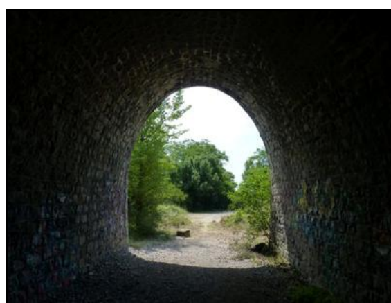
Eté, hiver, les extrémités de la galerie vues de l'intérieur