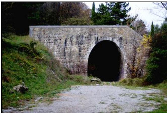
Ci-dessus et ci-dessous, la sortie du tunnel de Baza en été (à gauche) et en hiver (à droite)