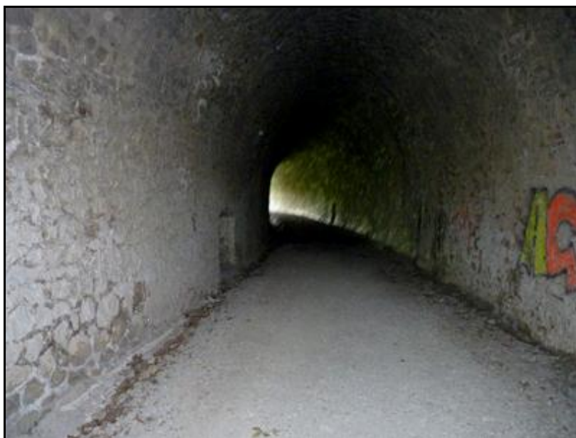
Ci-dessus et ci-dessous, la galerie du tunnel