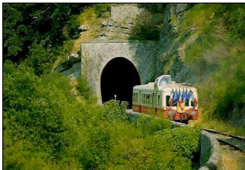
La dernière photo du tunnel de Baza en service

Si cette fiche comporte des erreurs ou des oublis, merci de nous le signaler.