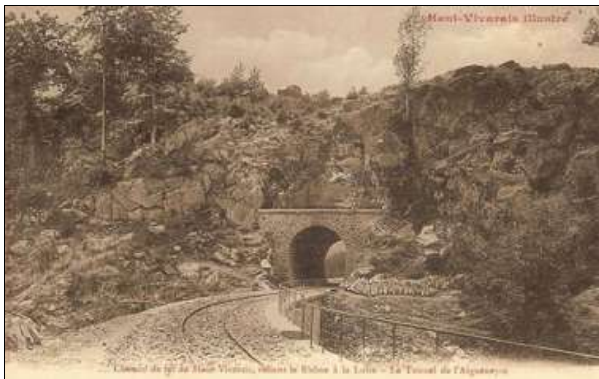
Une autre vue ancienne de l'entrée, cette fois bien nommée

Si cette fiche comporte des erreurs ou des oublis, merci de nous le signaler.