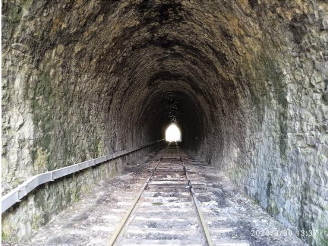
Vue vers l'entrée (30/03/2023)