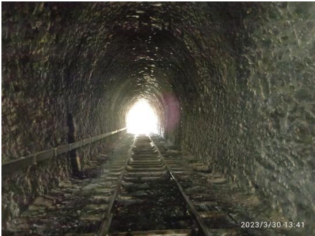
Vue vers l'entrée (30/03/2023)