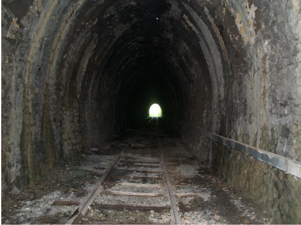
Vue vers la sortie depuis l'entrée (photo non datée)