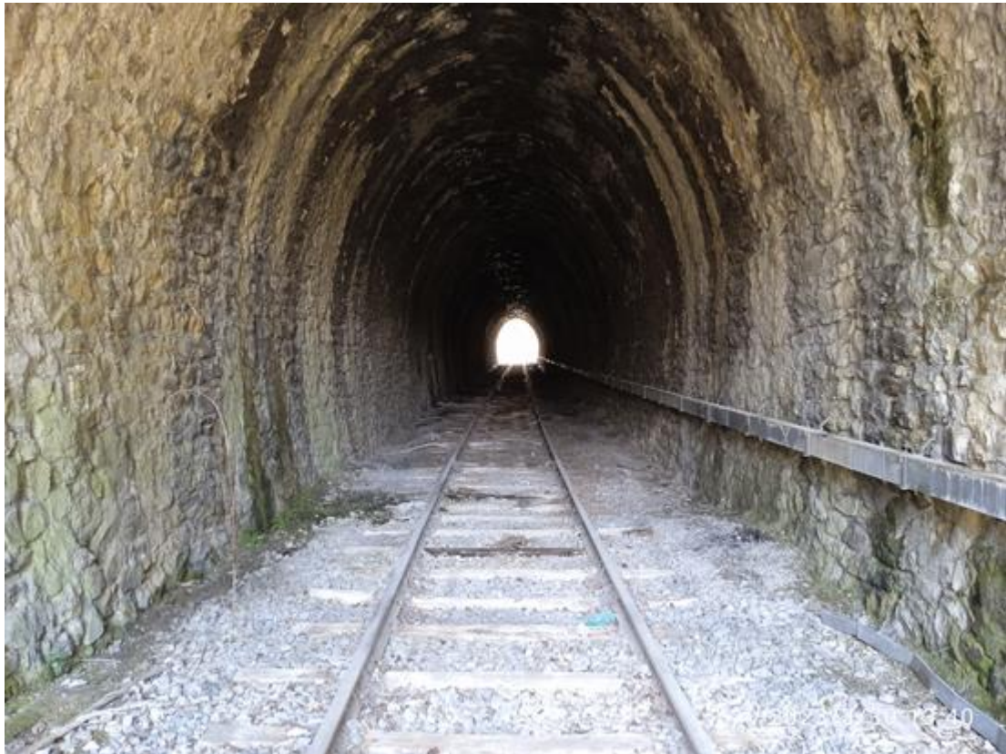
Vue vers l'entrée depuis la sortie (30/03/2023)