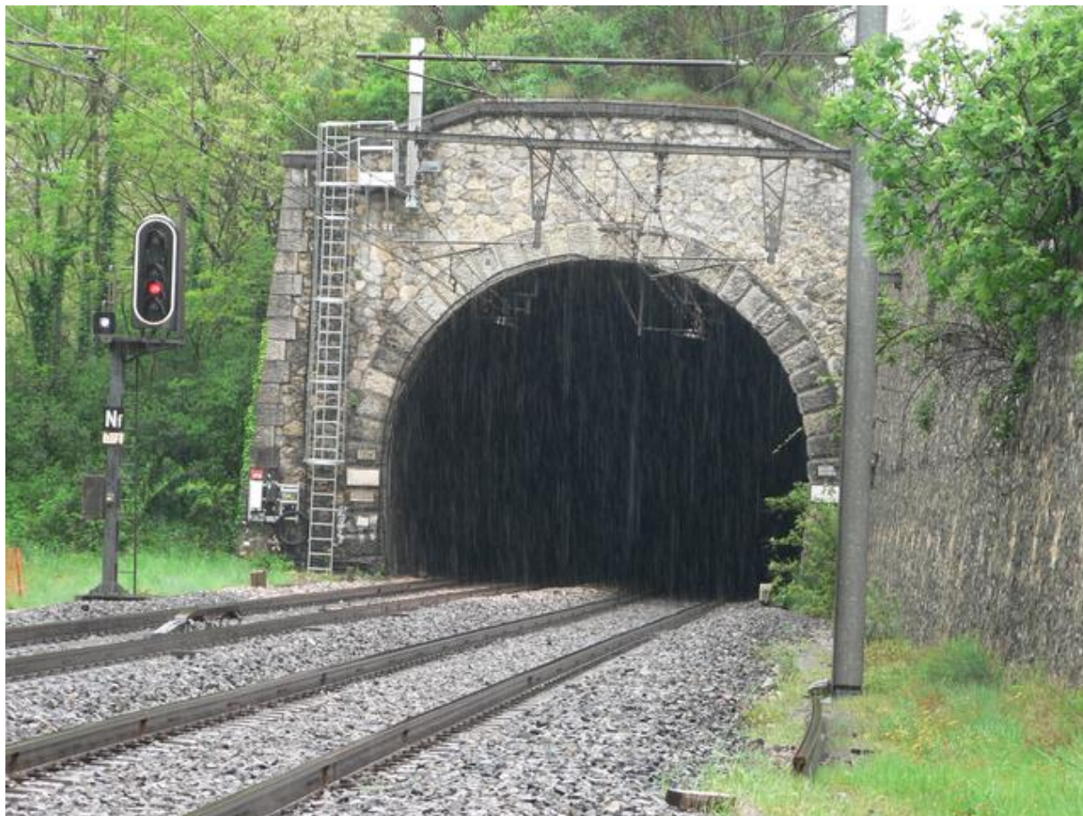
Par un temps bien pluvieux... (27/04/2015)