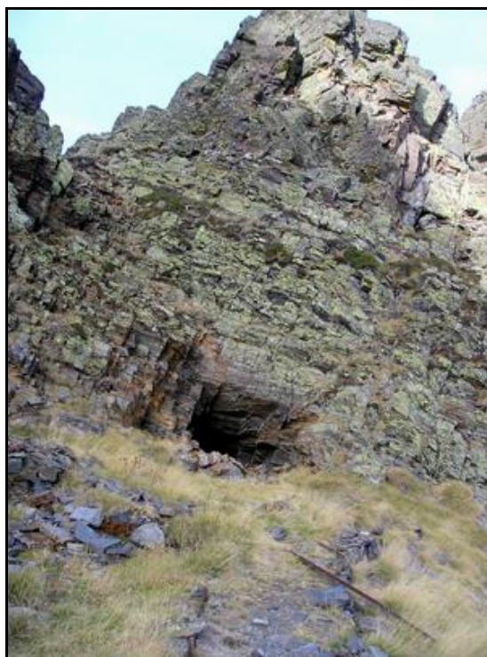
La sortie du tunnel avec des débris de voie Decauville