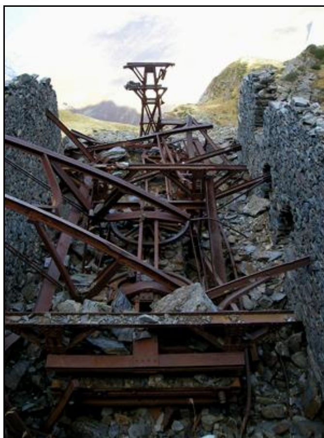
Ruines de la gare de transbordement et départ du télébenne qui descendait le minerai vers la vallée

Si cette fiche comporte des erreurs ou des oublis, merci de nous le signaler.