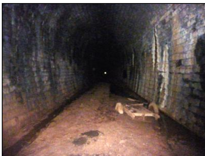
La charrette engloutie