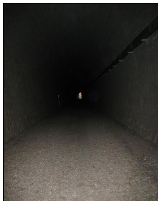
Et l'excellent état de la galerie

Si cette fiche comporte des erreurs ou des oublis, merci de nous le signaler.