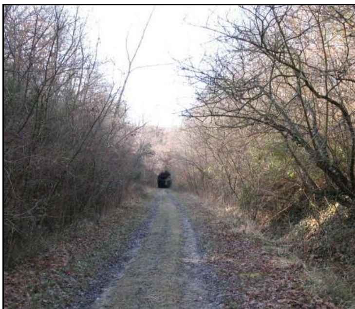
L'approche de l'entrée